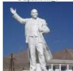
Памятник Ленину в Мургабе