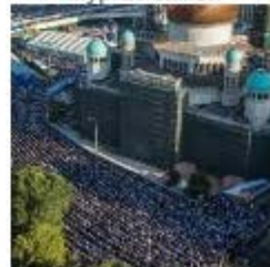
Рамазан в Москве_1