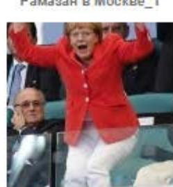
Болеют все: как политики поддерживают свои сборные в Бразилии 1

При посещении факультета пищевых технологий гостям показали функционирование физико-химической, аналитической, органолептической, сенсорной и других лабораторий на базе университета. Каждая из них оснащена современным оборудованием и отвечает европейским стандартам.