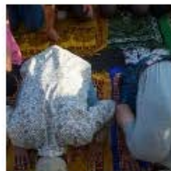
Рамазан в Москве_7