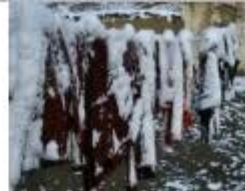
Забыли вовремя собрать постиранную одежду